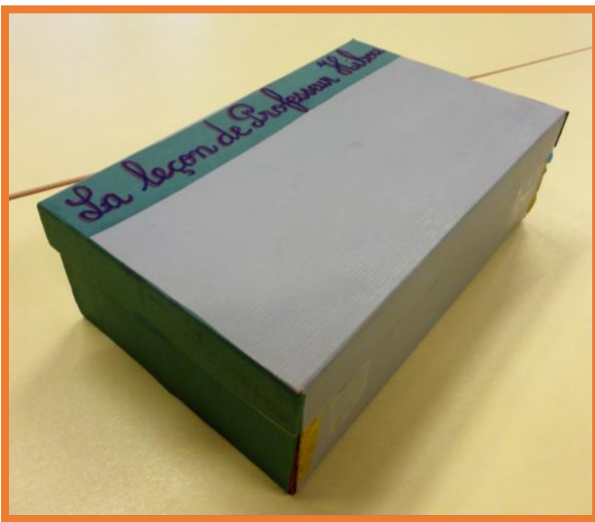
Se procurer une boîte à chaussures.

Vous trouverez ici les différentes étapes de réalisation, et n'hésitez pas à laisser libre cours à votre créativité !