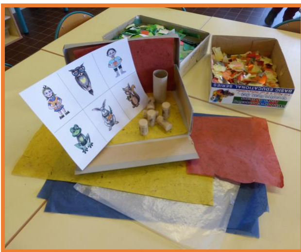
Rassembler le matériel de base nécessaire : dessins des personnages à découper, papiers variés, carton, peinture, 5 bouchons de liège, bouts de bois ou branches, 1 rouleau de carton, 1 pince à linge, colle blanche.